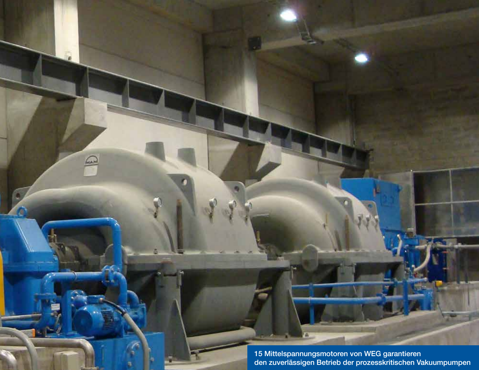
15 Mittelspannungsmotoren von WEG garantieren den zuverlässigen Betrieb der prozesskritischen Vakuumpumpen

Mittelspannungsmaschinen lösten dank üppiger Momentausstattung unser altes Anlaufproblem dieser Vakuumpumpen und sorgen nunmehr für den einwandfreien, störungsfreien Betrieb dieser für den Papierherstellungsprozess zentralen Anlage.“