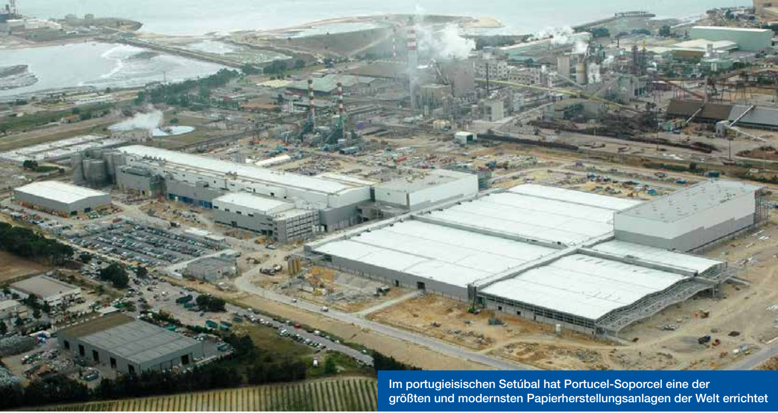
Im portugiesischen Setúbal hat Portucel-Soporcel eine der größten und modernsten Papierherstellungsanlagen der Welt errichtet

lieferer. Einer davon war Antriebsspezialist WEG, der den Auftrag zur Lieferung der in die neue Papiermaschine integrierten Elektromotoren erhielt. Ganze 650 Niederspannungsmotoren und 16 6-kV-Mittelspannungsmotoren mit Nennleistungen zwischen 0,37 und 2.800 kW lieferte WEG nach Setúbal.